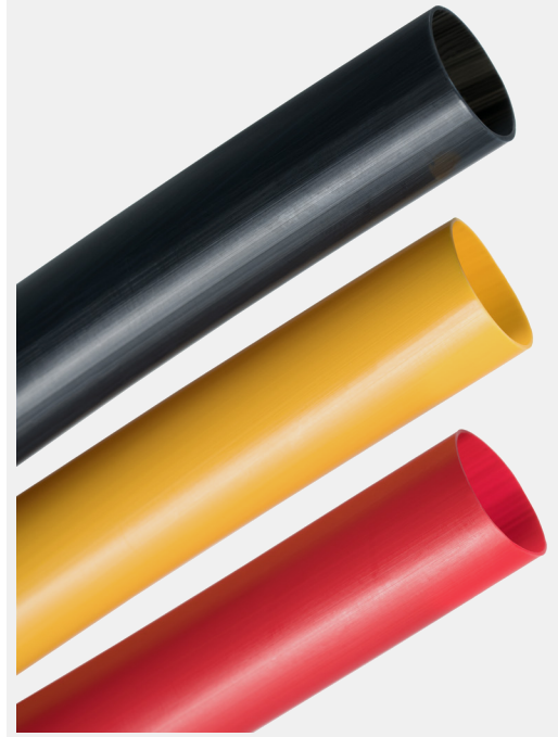
PTFE 热缩管提供收缩率为 2:1 和 4:1 的产品。

Zeus PTFE 热缩管的收缩率为 2:1 和 4:1。这些热缩管的使用温度上限为 260 °C (500 °F)，下限为 -200 °C (-328 °F)，是目前具有最广泛工作温度的产品之一。PTFE 热缩管具有优异的介电强度，非常适用于导线和电气组件的封装。户外使用时，PTFE 热缩管几乎完全不受天气的影响。我们的 2:1 PTFE 热缩管提供从 1/8 英寸到 1 英寸的分数尺寸，并提供 30 到 0 的 AWG 尺寸。我们的 2:1 PTFE 热缩管也可提供标准管、薄壁管、工业管和轻质管各种不同壁厚。